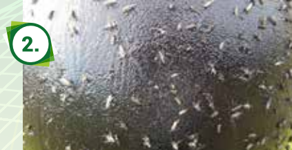
Un ballon noir piège à taons Sticky Trap