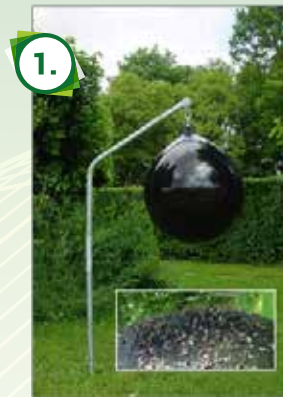
Le piège Kylix Loer